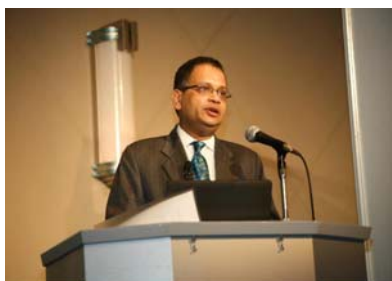
アジアビジネスセミナー（3月12日）

http://www.itbazaar-kyoto.com/forum/technology_seminar.html