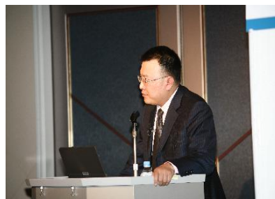
アジアビジネスセミナー（3月12日）