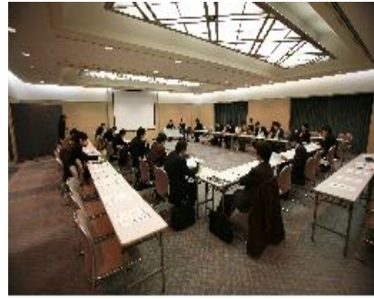
技術セミナー（3月13日）