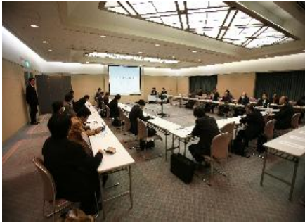
技術セミナー（3月12日）